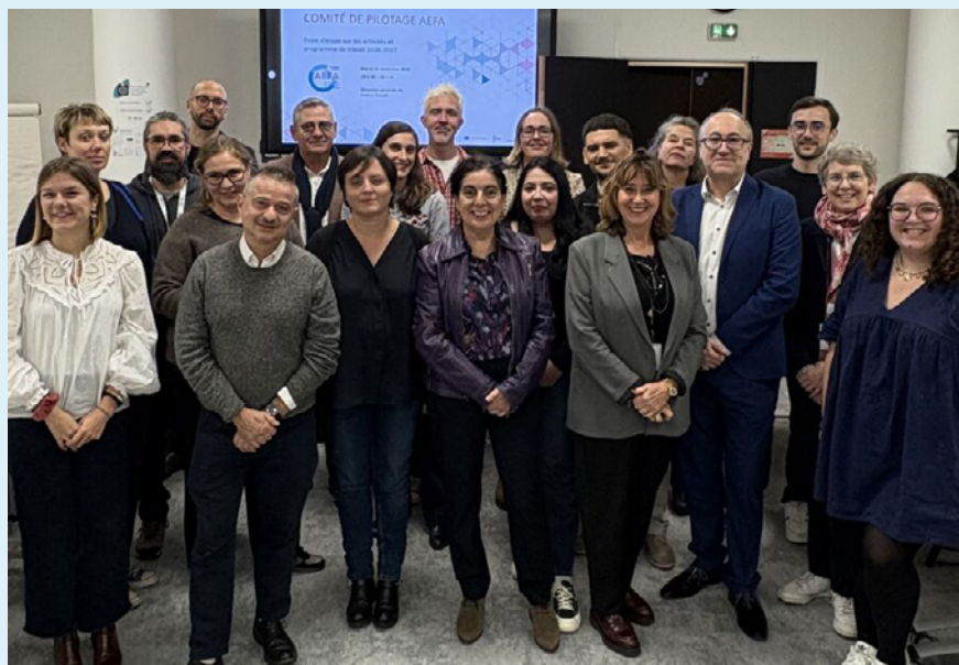
Les membres du Comité de pilotage, 2025