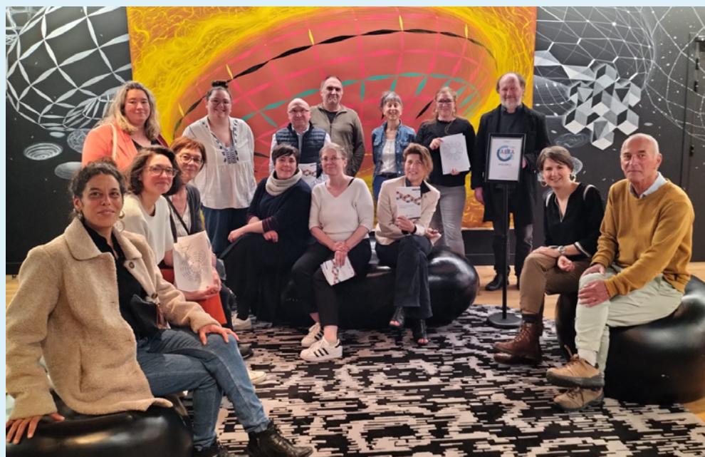
Le groupe de travail RECTEC lors d'une réunion de travail, 16 mai 2025

Les travaux ont permis d'identifier les principaux effets des démarches RECTEC, ainsi que des facteurs de réussite, des points de vigilance et des pistes d'amélioration. Une synthèse de l'étude a été publiée en décembre 2024.