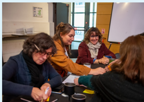
10 ans de l'AEFA à la Bellevilloise, Paris, le 10 décembre 2024.